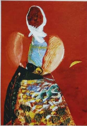
1. Греди Асса. Женска фигура