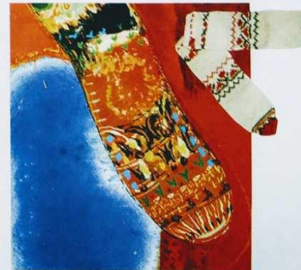
6. Греди Асса, Композиция